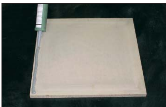
4. Fogmassa påförs golvluckan.