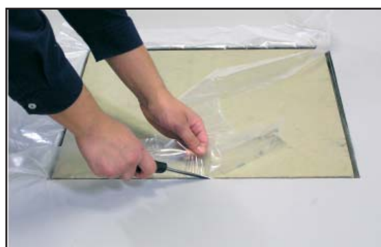
6. Plastfolie avlägsnas alt. renskäres och nedförs i spaltens botten.