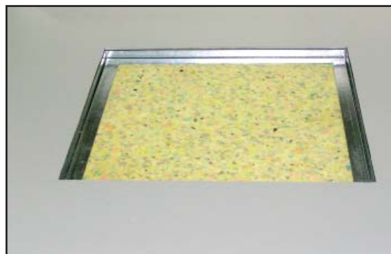
2. Aggregat med aggregatlock och ljudisolering.