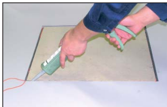
8. Spalten fogas