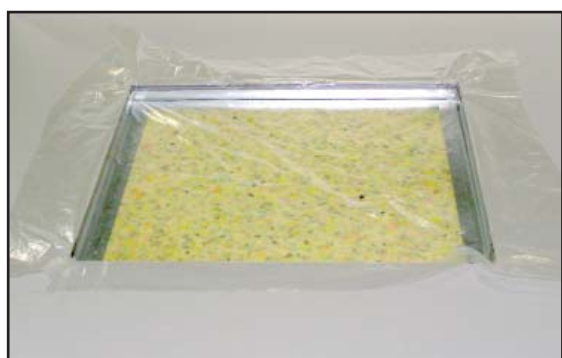
3. Plastfolie placeras.