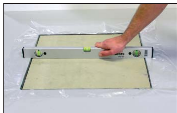
5. Golvluckan justeras med hjälp av rättskiva.