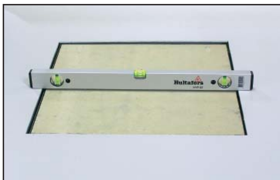
1. Golvluckans avvikelse i höjd.